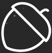
FRUTO CON CÁSCARA